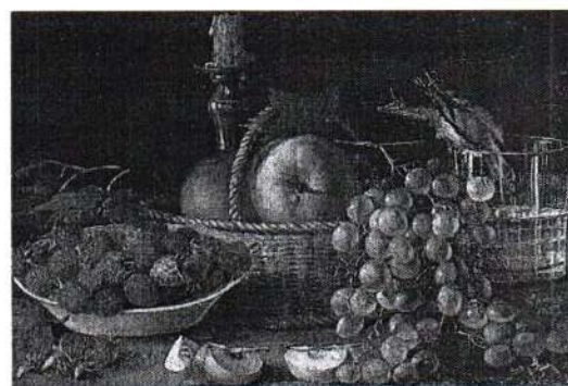
И.Ф.Хруцкий, «Плоды и птичка» (1833)

Ученики дают различные ответы, что изображение нарисовано более объемно и т.п. Учитель задает следующий вопрос: Как вы думаете, являются ли синонимами понятия «трехмерное изображение» и «3D-изображение»? После изучения новой темы связанной с процессом 3D-моделирования, вопросы, которые может задать педагог для дальнейшей работы по созданию проекта могут быть такие: Подумайте, где можно использовать 3D-моделирование в нашем регионе? С какой целью? В качестве подсказки можно сказать о том, что особое всеобщее внимание в настоящее время уделяется проблеме сохранения истории деревянного зодчества Томска, необходимости сохранения информации об утраченном, а также демонстрация красоты сохраненного зодчества. Возможно ли это сделать при помощи современного высокотехнологичного оборудования или 3D-моделирования и как?