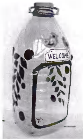
Фото 1 Кормушка для синиц

Рисунки в приложениях нумеруются и подписываются. Их название помещают под рисунком. Например: